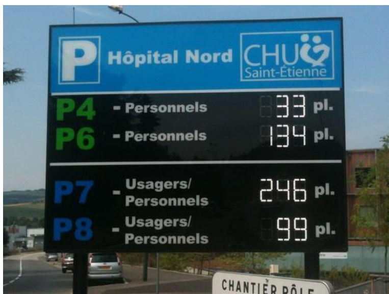
CHU de Saint Etienne