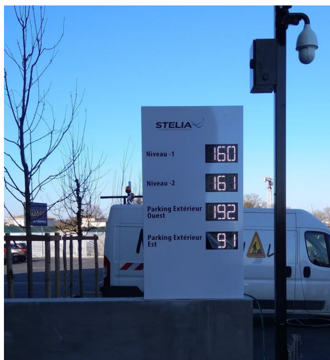
Stelia - Colomiers