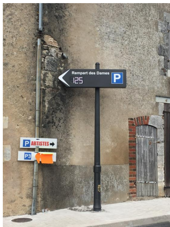
Ville de Sancerre